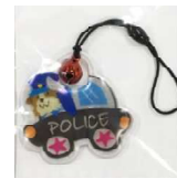
りんりんパトカー