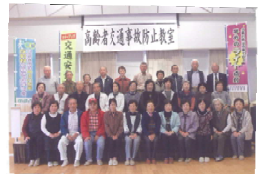
昨年の実施教室の様子

平成27年の香川県における交通事故死者数は、 やはり約6割を65歳以上高齢者が占めている状況です。 交通事故に遭わないようにするには、高齢者自身が 防止策を身に付けることが必要です。